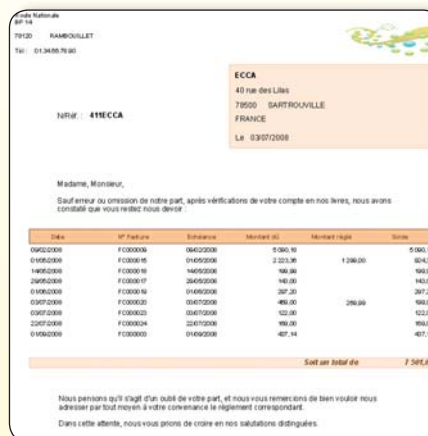
Le modèle de lettre de relance prêt à l'emploi ou personnalisable aux couleurs de votre entreprise.

Le suivi des échéances clients permet d'éditer très simplement des lettres de relance aux clients en retard de paiement par rapport à une date d'échéance.